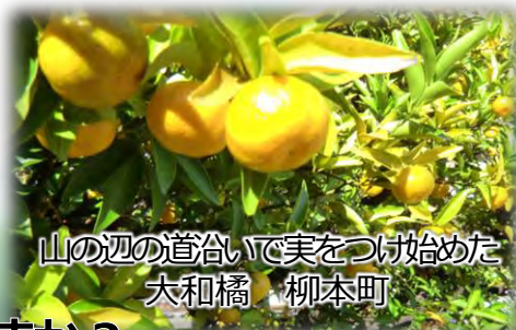
山の辺の道沿いで実をつけ始めた 大和橘 柳本町