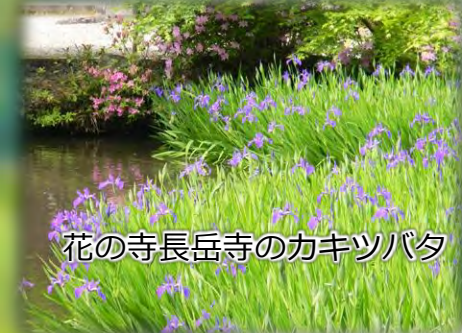
花の寺長岳寺のカキツバタ