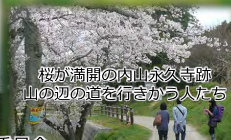
桜が満開の内山永久寺跡 山の辺の道を行きかう人たち

問い合わせ 天理大学エコキャンパス実行委員会 電話：0743-63-9012（月～金 9:00～17:00）