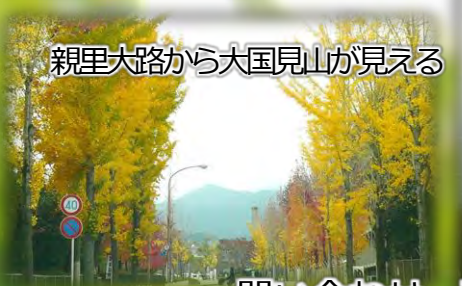
親里大路から大国見山が見える