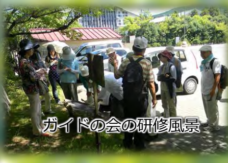
ガイドの会の研修風景