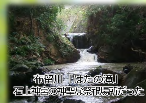
布留川「はたの滝」 石上神宮の神聖な祭祀場所だった